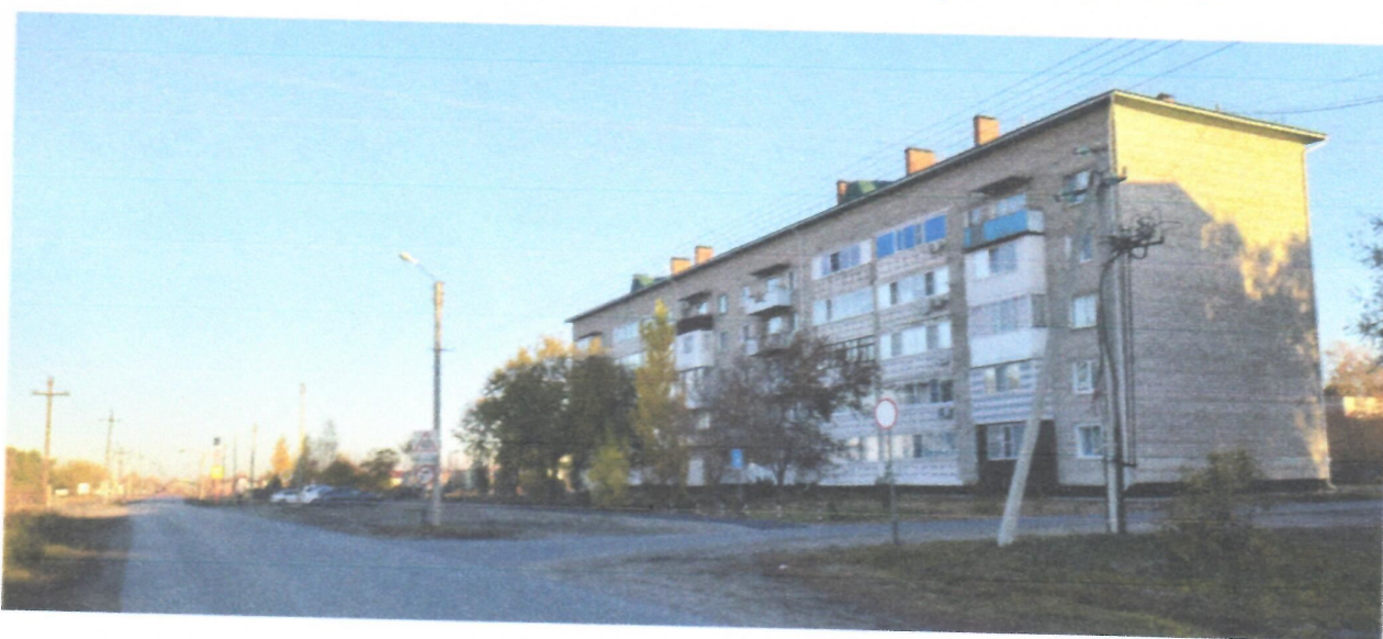
Пересечение пер. Целинный и подъезд к д/с «Журавушка»