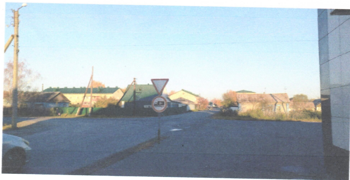
Пересечение ул. Гоголя и пер. Целинный