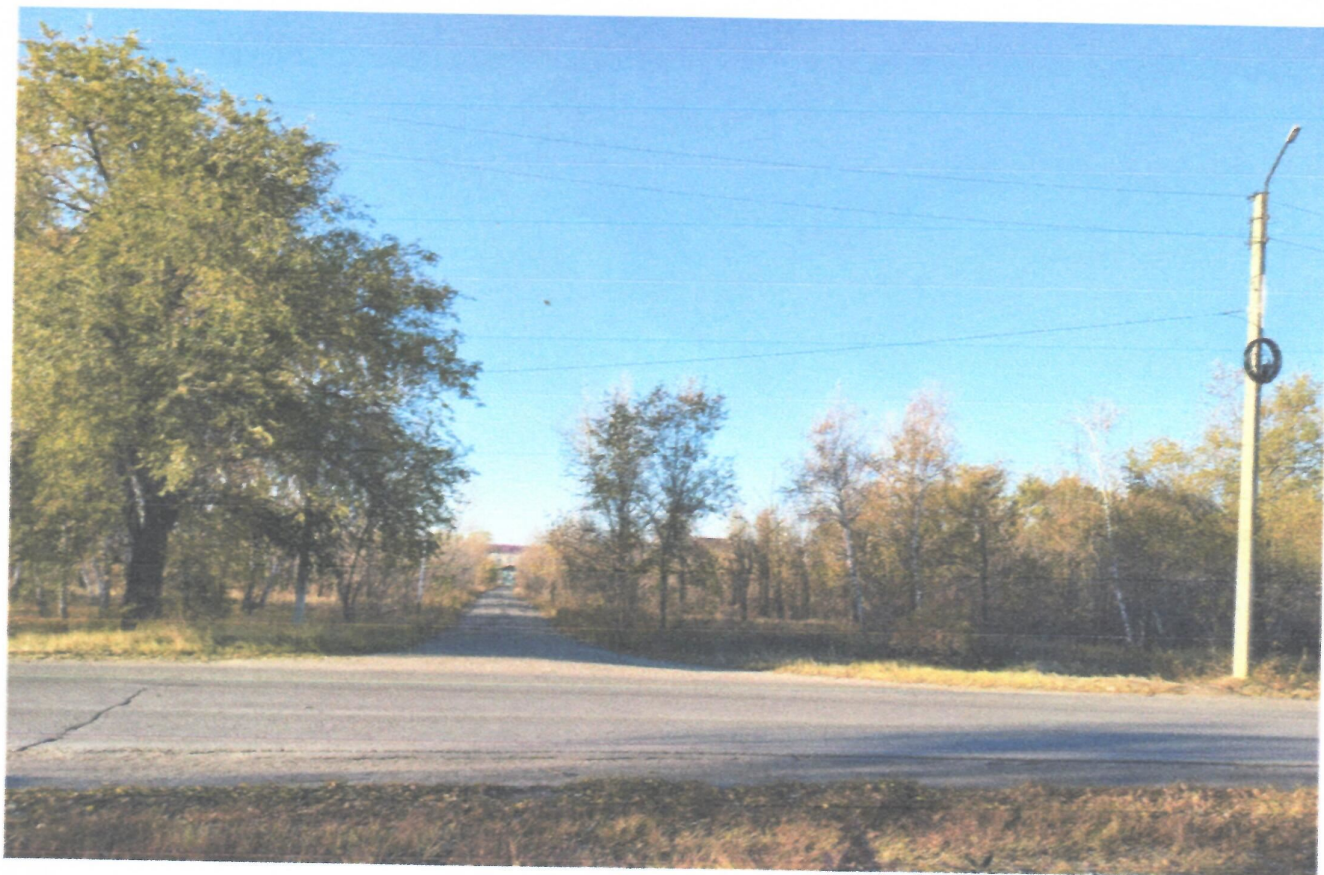
Пересечение ул. Октябрьская и пер. Школьный