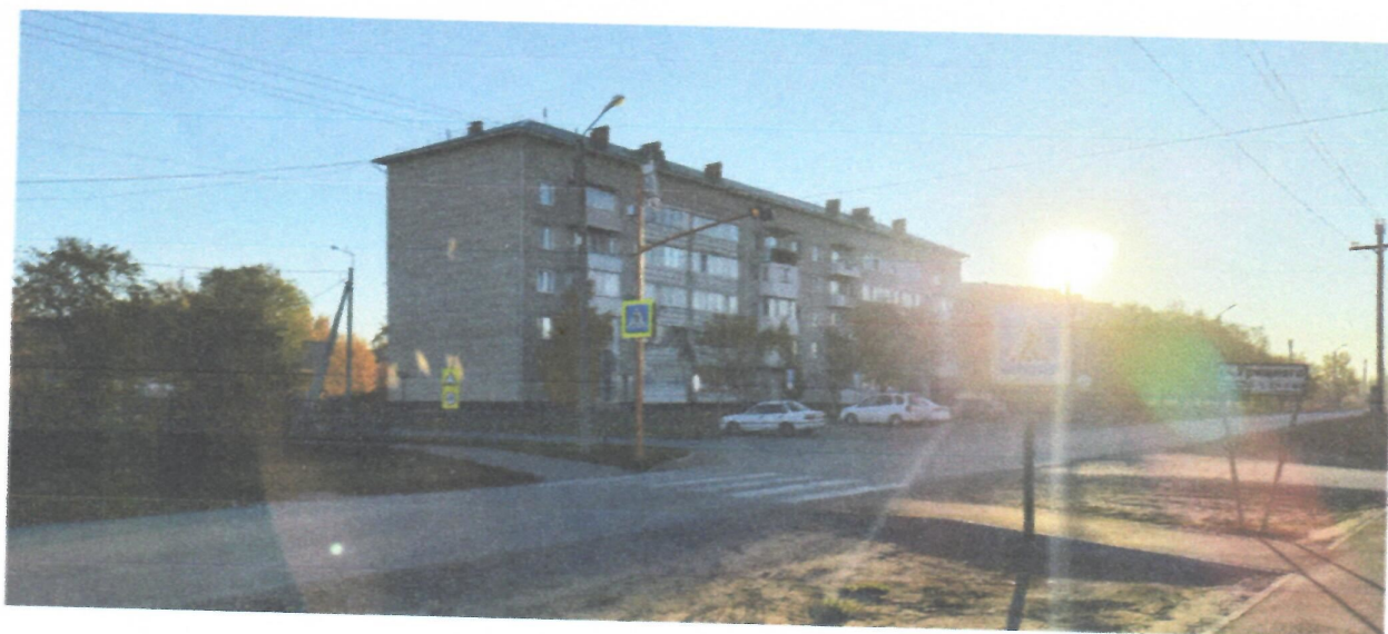
Пересечение пер. Целинный и проезд между домами 5 и 123