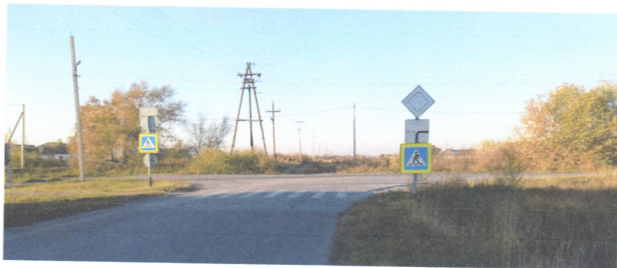
Пересечение ул. 40 лет Октября и проезд к жилым домам