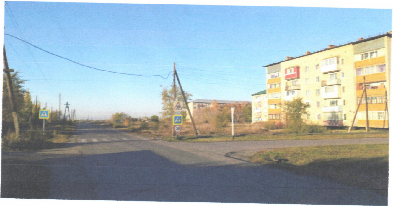
Пересечение ул. 40 лет Октября и пер. Колхозный