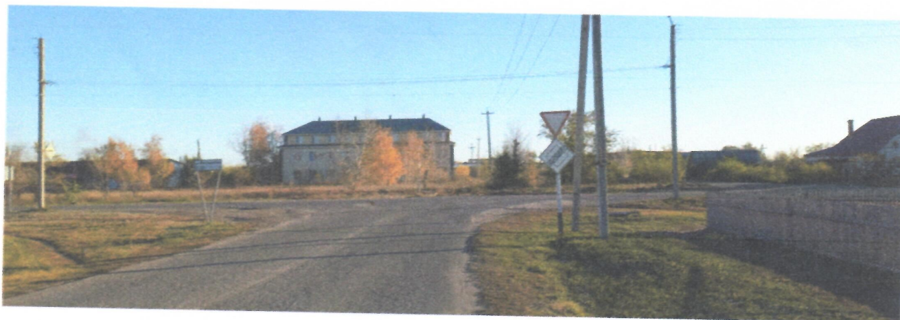
Пересечение ул. 40 лет Октября, ул. Кольцевая и подъезд к Ремтехпредприятию